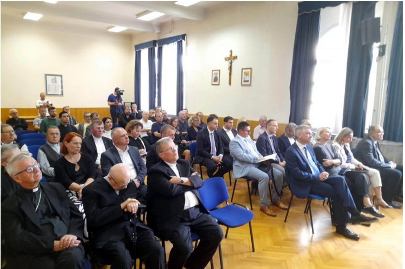
Svečana akademija u Pazinskom kolegiju

15.09.2022 16:33 | Autor: Anđelo DAGOSTIN