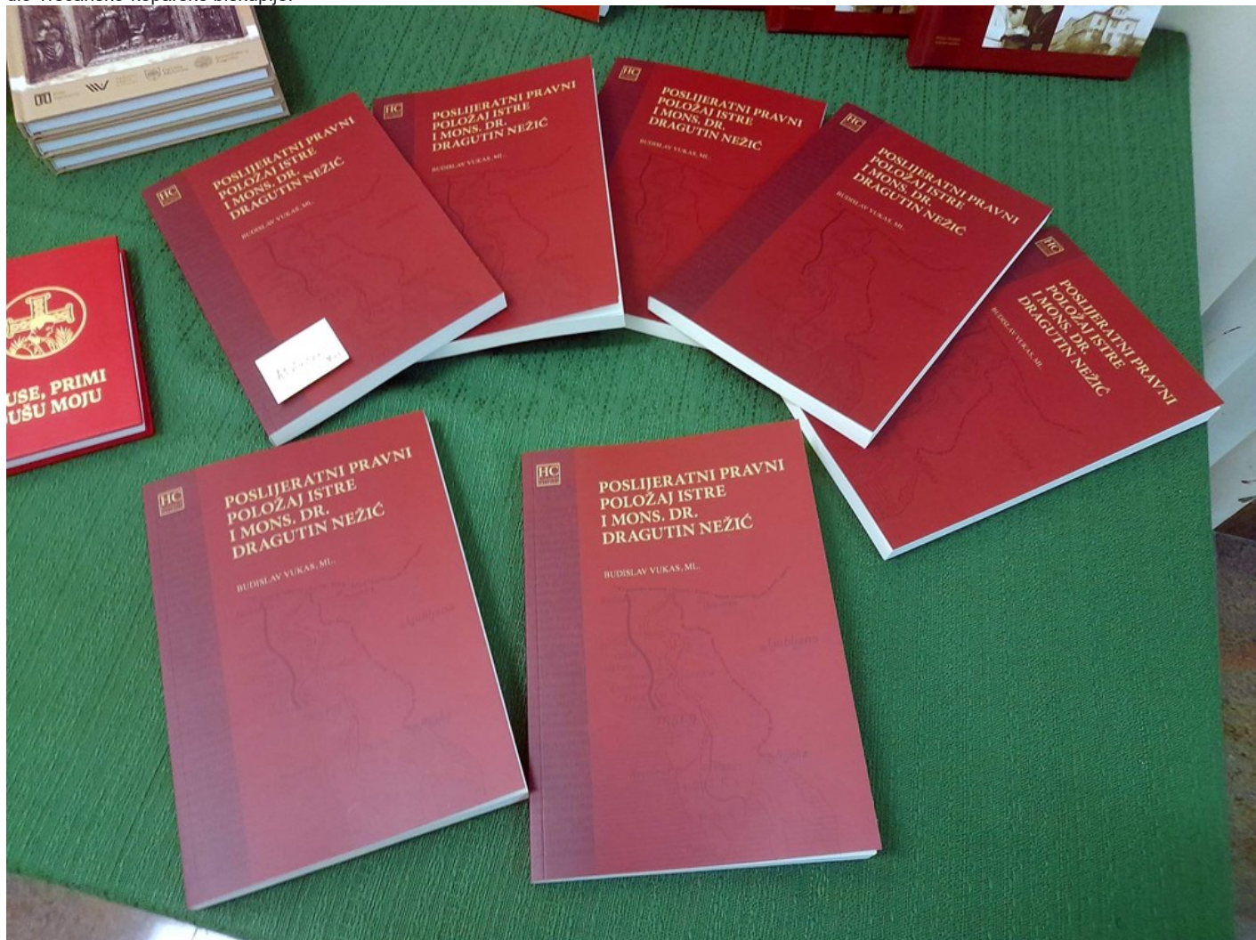
Knjiga "Poslijeratni pravni položaj Istre i mons. dr. Dragutin Nežić"

Spomenimo i da budući biskup Dragutin Nežić (1908. – 1995.) od 1947. obavlja dužnost administratora jugoslavenskog dijela biskupija Tršćanske i Koparske (apostolska administratura). Imenovan je i punim administratorom na tome području 1948., a 1949. i administratorom Porečko-pulske biskupije. Tako je u njegovoj osobi bila ujedinjena istarska Crkva, iako još (do 1977.) formalno podijeljena u Porečko-pulsku biskupiju i jugoslavenski dio Tršćansko-koparske biskupije.