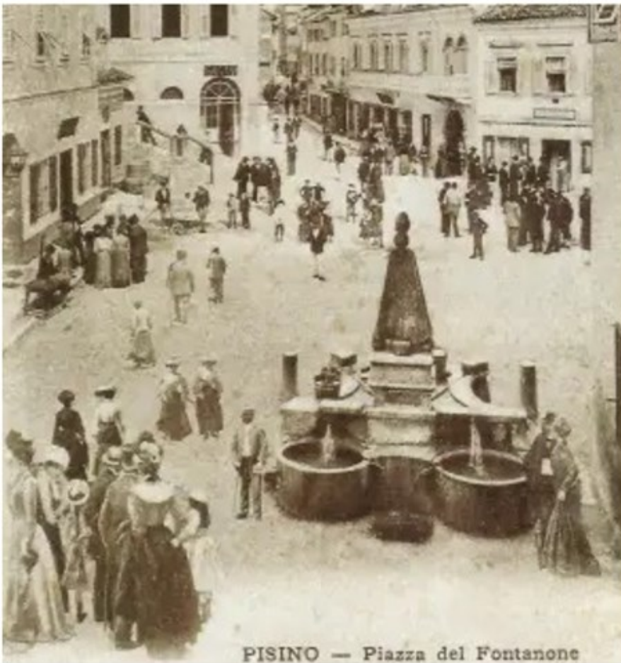
Stara fontana sagrađena 1790. godine (Stari trg, Pazin) / Radenko Sloković

31.10.2021 17:47 | Autor: Anđelo DAGOSTIN